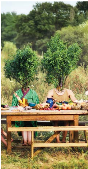
Mon Palais est un paysage ©Denis Rochard