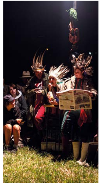
France Profonde

24 Du 15 mai au 30 juin , aux horaires d'ouverture Médiathèque Victor-Hugo, 5 esplanade de l'Europe, Grandchamp-des-Fontaines www.bibliotheques.cceeg.fr/grandchamp