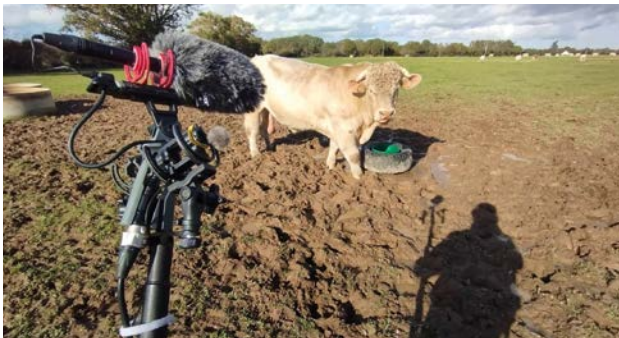
Mass & Terre ©Simon Oriot