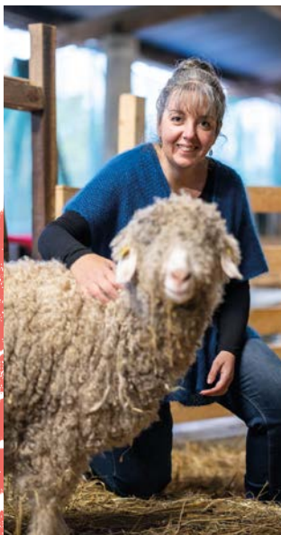
Ferme Mohair de l'Erdre

2 Dimanche 9 juin de 11h à 17h30 Lieu-dit La Pommeraie, Casson www.mohairdelerdre.com