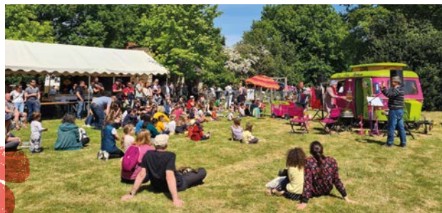
Écomusée rural du Pays nantais, Vigneux-de-Bretagne

L'Amicale Laique de Notre-Dame-des-Landes propose une rando de ferme en ferme