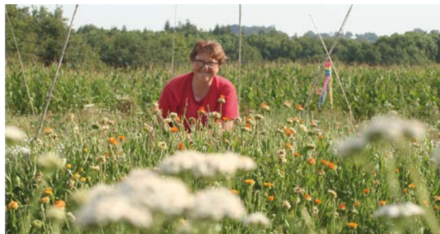
Ferme Pense aux Baumes

20 Samedi 15 juin , à 9h30, 11h, 14h et 15h30 (durée des visites : 1h) Ferme Pense aux Baumes, 3 La Cochelière, Nort-sur-Erdre Tarif au chapeau Réservation sur : penseauxbaumes@gmail.com www.local.bio/pense-aux-baumes