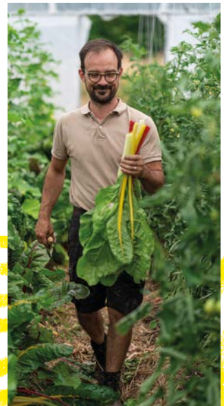
L'Eco Ferme Buissonnière, Treillières