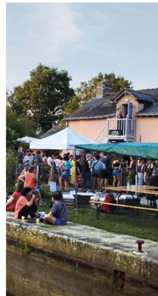
La cueilleuse, Nort-sur-Erdre

11 Samedi 25 mai de 14h à 17h Domaine de Land Rohan, Vigneux-de-Bretagne Tarif 25€ www.lesgardiennesdelaterre.com