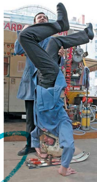
La Quincaillerie Parpassanton